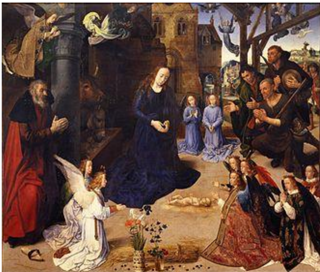
De aanbidding der herders, Hugo van der Goes, ca 1475-76 te Gent

voorganger orgel cantorij Vrijburg olv lectores